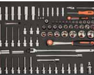
ЛОЖЕМЕНТ 26" Размеры: 543 x 445 мм

Предложение действительно с 1 апреля 2017 года по 31 июля 2017 года. Рекомендованная розничная цена, включая НДС. Предложение ограничено.