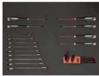
ЛОЖЕМЕНТ 26" Размеры: 543 x 445 мм