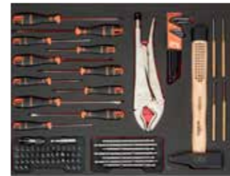
ЛОЖЕМЕНТ 26" Размеры: 543 x 445 мм