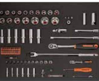
ЛОЖЕМЕНТ 26" Размеры: 543 x 445 мм

Предложение действительно с 1 апреля 2017 года по 31 июля 2017 года. Рекомендованная розничная цена, включая НДС. Предложение ограничено.