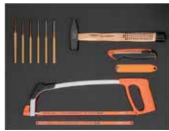
ЛОЖЕМЕНТ 26" Размеры: 543 x 445 мм