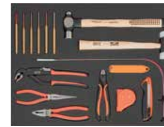
ЛОЖЕМЕНТ 26" Размеры: 543 x 445 мм