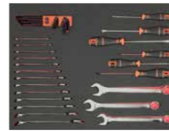
ЛОЖЕМЕНТ 26" Размеры: 543 x 445 мм