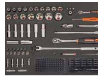
ЛОЖЕМЕНТ 26" Размеры: 543 x 445 мм

Предложение действительно с 1 апреля 2017 года по 31 июля 2017 года. Рекомендованная розничная цена, включая НДС. Предложение ограничено.