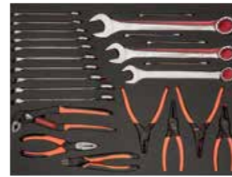
ЛОЖЕМЕНТ 26" Размеры: 543 x 445 мм